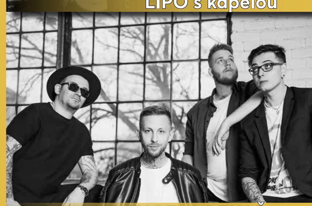
LIPO s kapelou